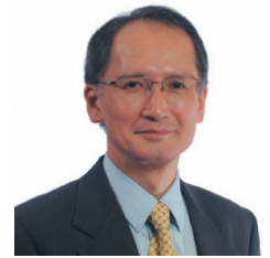
長嶺 安政 日本国総領事

長嶺新領事夫妻は長旅の疲れも見せず着任当夜ホテルニッコウ・サンフランシスコで催された姉妹都市50周年記念行事に招待され、関 淳一大阪市長主催の返礼パーティーに早速出席され関係者と懇談される等就任後初の公務をこなされておりました。