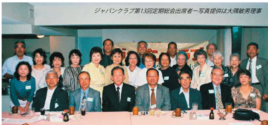
ジャパングラブ第13回定期総会出席者一写真提供は大隅敏男理事

【註】2008年度ジャパングラブの会長等役職担当者等は定款に則り8月1日開かれる理事会において理事の互選により決定される予定です。